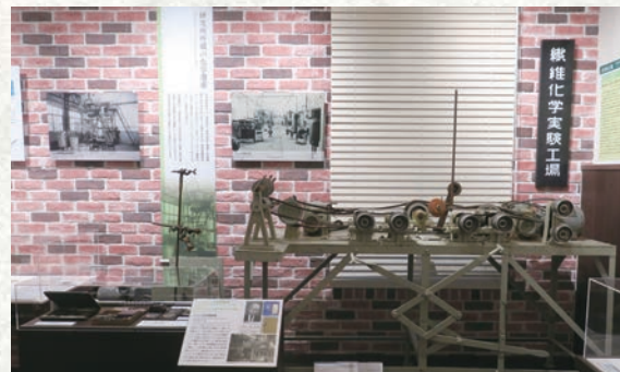
「日本のビニロン工業の発祥を示す資料」*