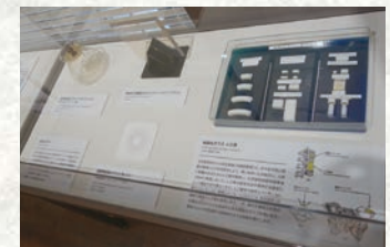
結晶化ガラスと人工骨